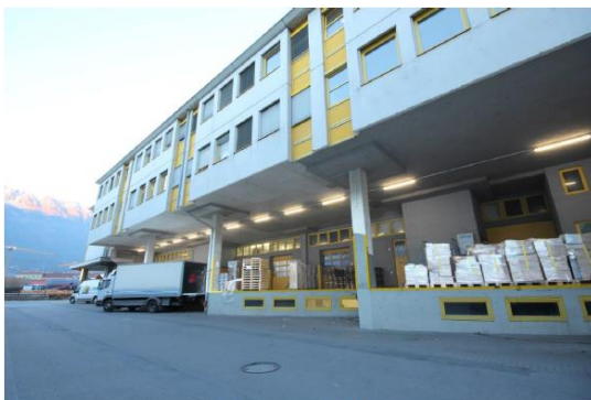
Rampenanlage – 5 Stück