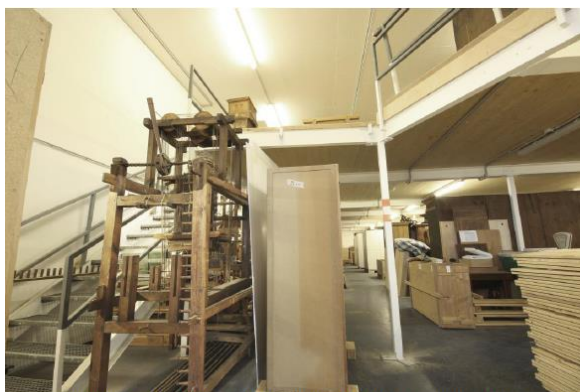
Zugang zur oberen Lagerfläche über Treppe und Beladung mittels Stapler