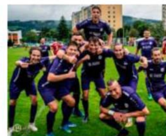
Ab 2025 soll der IAC auf dem neuen ASKÖ-Platz jubeln.

In den Vereinbarungen ist vorgesehen, dass die neu zu errichtende ASKÖ-Sportanlage in die IIG eingebracht werden soll. Hinsichtlich der Bestimmungen des Sportstättenchutzgesetzes und einer damit möglicherweise verbundenen Verringerung des Verkehrswertes ist diese Frage noch eingehend zu prüfen, auch hinsichtlich des Gebäude- und Anlageneigentums unter Einbindung der IIG. Da die ASKÖ ihre Zusage zeitlich bis Jahresende befristet hat, ist eine Beschlussfassung trotz dieser offenen Frage erforderlich.