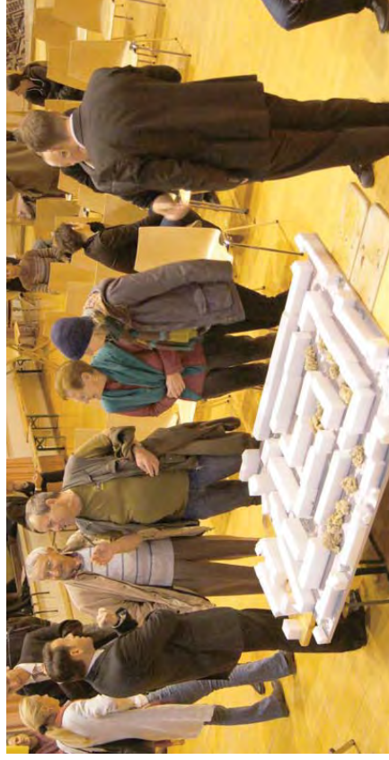
Im Ideenbüro wurde ebenso angeregt diskutiert wie in den Workshops und Gesprächsrunden.

Für die Bewohner bot sich so eine Vielzahl an Möglichkeiten, ihre Vorschläge einzubringen, Ideen und Wünsche zu besprechen. Die verschiedenen Varianten einer möglichen Verdichtung wurden durchgespielt – mit all ihren Vor- und Nachteilen.