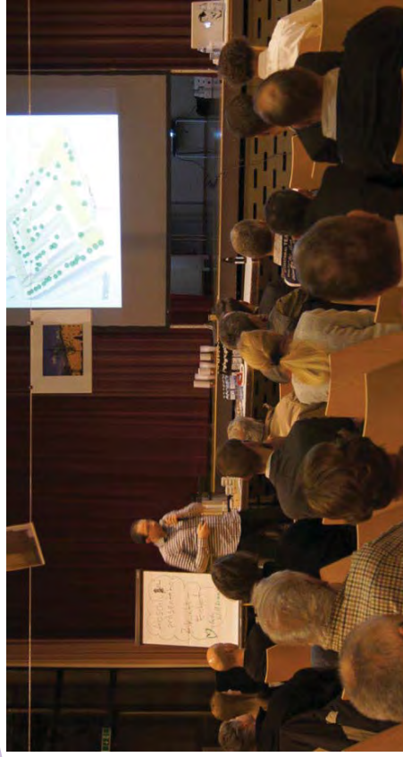
Die Bestandsmieter erhielten Einblicke in sämtliche Überlegungen.

Als Ergebnis der vor ort ideenwerkstatt® kristallisierte sich eine Kombination aus Erhalt von Bestandsobjekten und Ersatzneubauten heraus. Die IG informierte die Mieter mit Informationsschreiben über dieses Ergebnis und bereitete einen Architekturwettbewerb vor, welcher in der zweiten Jahreshälfte 2016 durchgeführt wurde. Das Siegerprojekt sieht Neubauten im Bereich der Kranewitterstraße und der Lindenstraße sowie im inneren Bereich des Eichhofs vor. Die Gebäude entlang der Gump- und der Langstraße bleiben erhalten. Das Projekt folgt der Gebäudestruktur des Bestands, wodurch der Grünbestand erhalten bleibt.